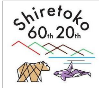
[周年記念ロゴマーク]

周年記念事業実行委員会では、各種の広報資材等及び各機関、団体が例年実施している地域イベント等に本ロゴマークを掲載し、積極的なPRに努めてまいります。