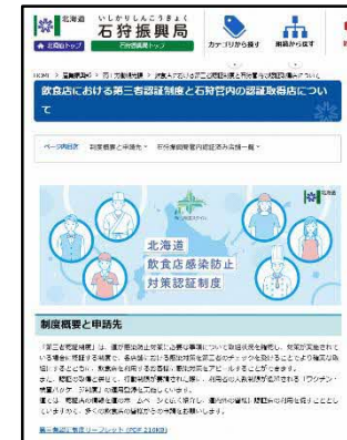
振興局HP（第三者認証制度）