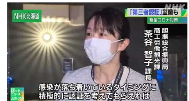
▲NHK室蘭ニュース（取組の可視化）