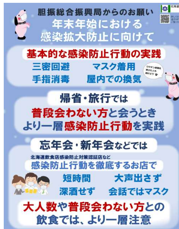
▲住民向け啓発ポスター