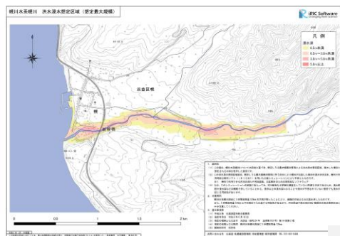
洪水浸水想定区域図 (iRIC)