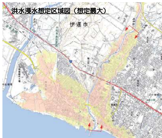
まちづくり等での活用を視野にした多段的な浸水リスク情報の検討 （胆振総合振興局）

想定最大規模や計画規模のみならず、より高頻度で発生する降雨規模での洪水氾濫区域を検討する