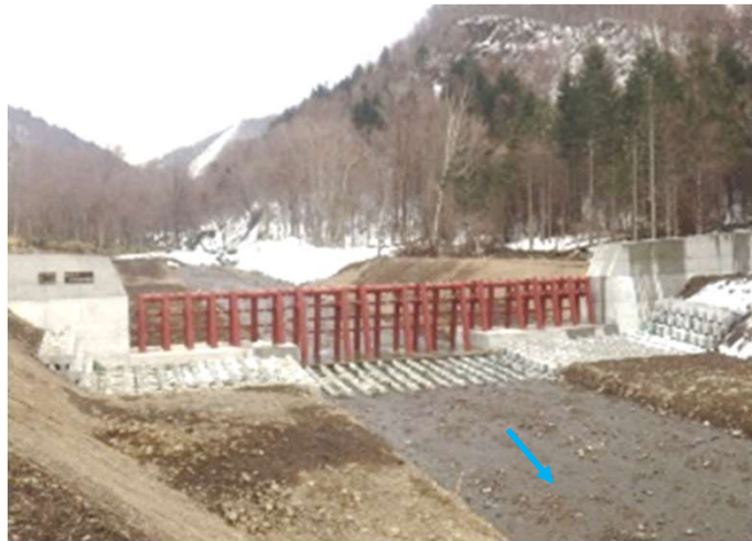
（紋別川）砂防堰堤の整備