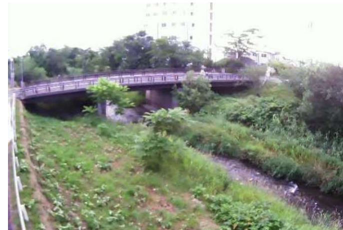
（気門別川）簡易型河川監視カメラによる映像提供