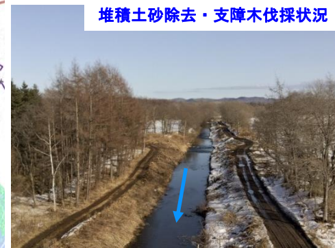
堆積土砂除去・支障木伐採状況

■ 被害の軽減、早期復旧・復興のための対策 ・ 危機管理型水位計の設置・情報提供 ・ 防災ハザードマップ（津波・洪水・土砂災害）の作成・周知 ・ 防災教育の実施 ・ 防災メール、防災行政無線等を活用した情報発信の強化 ・ 高潮浸水シミュレーション（想定最大規模）の実施・公表