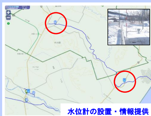
水位計の設置・情報提供