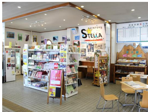
〔駅構内に設置した店舗〕