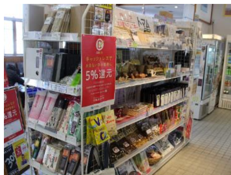
〔多くの特産品や土産品を揃える〕

や菓子店の既存商品のパッケージを改良し、土産品にする等、商品開発を行うことができた。これも商工会が運営する強みの一つだった。