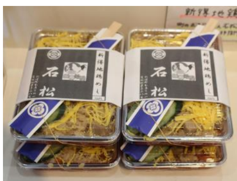
〔特産品の地鶏で新規開発した駅弁〕

また、開店以来、駅の売店という性質上、来店客から駅弁の要望が数多く寄せられたほか、土産品となる菓子類の充実も求められたことから、町内の飲食店による弁当の新規開発