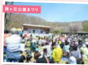
緑ヶ丘公園まつり