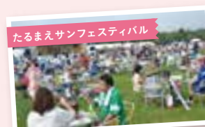
たるまえサンフェスティバル