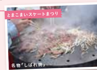
とまこまいスケートまつり