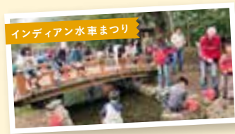
インディアン水車まつり