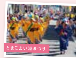
とまこまい港まつり