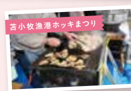
苫小牧漁港ホッキまつり