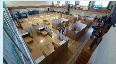
北海道版避難所マニュアル (感染対策) 検証