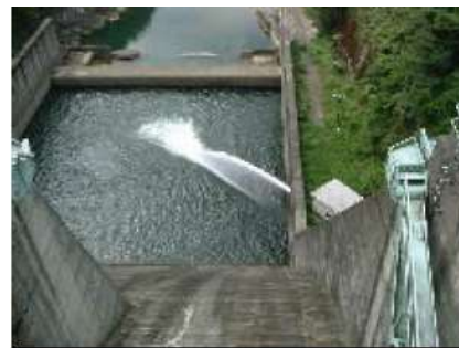
③河川維持用水 (ダム、堰)