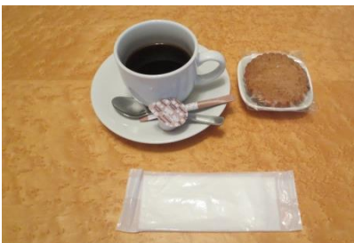
⑦A セット【ホットドリンク （コーヒー・紅茶）＋クッキー】