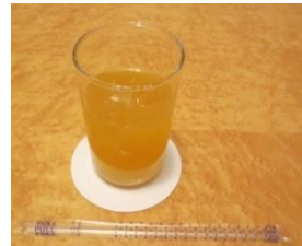
⑥オレンジジュース