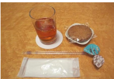
⑧B セット【アイズドリンク （コーヒー・紅茶）＋クッキー】