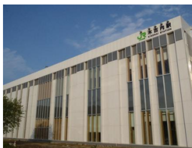
木古内駅(木古内町)