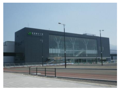
新函館北斗駅(北斗市)