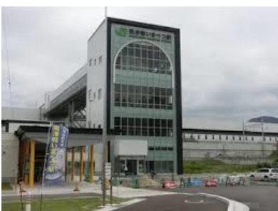
奥津軽いまべつ駅(青森県今別町)