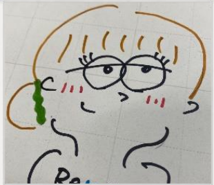
クラスメイトが書いた似顔絵