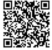
二次元バーコード

電子申請アドレス https://www.harp.lg.jp/epRqmZcd