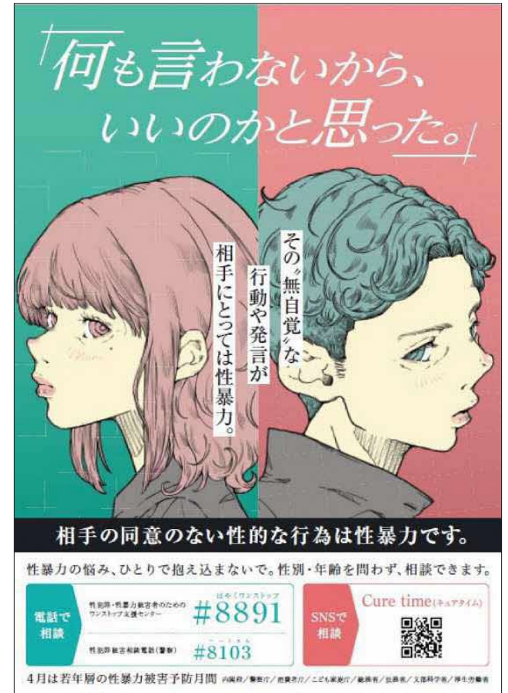
<ポスター/ステッカー>