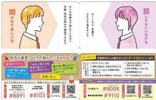
<二つ折り啓発カード(表面・中面)>