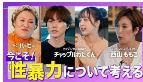
<令和7年度作成動画(30分)>