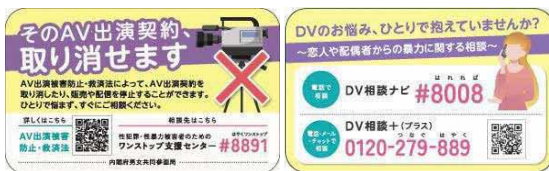
<啓発カード(表面・裏面)>