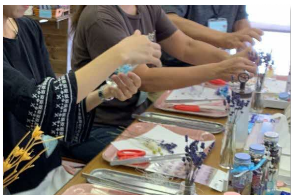
〔ものづくり体験が楽しめる〕