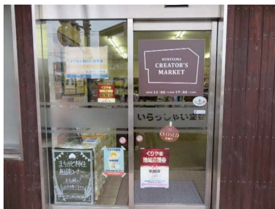
〔感染予防対策も実施している〕

町民に愛されるスペースとして、町外から訪れる人々を温かく迎え、駅を中心に栗山町に賑わいを生む場所となるよう取り組んでいきたい。