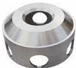
【遠心分離機用部品】

鑄造法を活かした複雑立体形状の造形を得意としており、製造の能力約1t/個の製品を特殊鋼にて製造しています。また、古くて手元に図面のない製品でも、スケッチを行い図面を起こし、製品の再生・製作を可能にします。