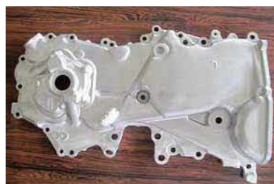
【タイミングチェーンケース製品】

売上全体の80%は自動車関係部品であり、かつ耐圧部品(最大1.75MPa)です。これに対応すべく、真空鑄造+局部加圧を用いて「鑄巣」をコントロールしています。