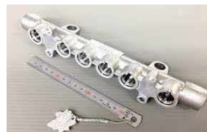
【グラビティ鑄造から変更した製品】

自動車分野では「HV、EV化」が益々主流になり、軽量化が求められます。現在の工法(鑄物、グラビ等)からのADC12への切り替えに関して「ご協力」出来る事があればと思います。