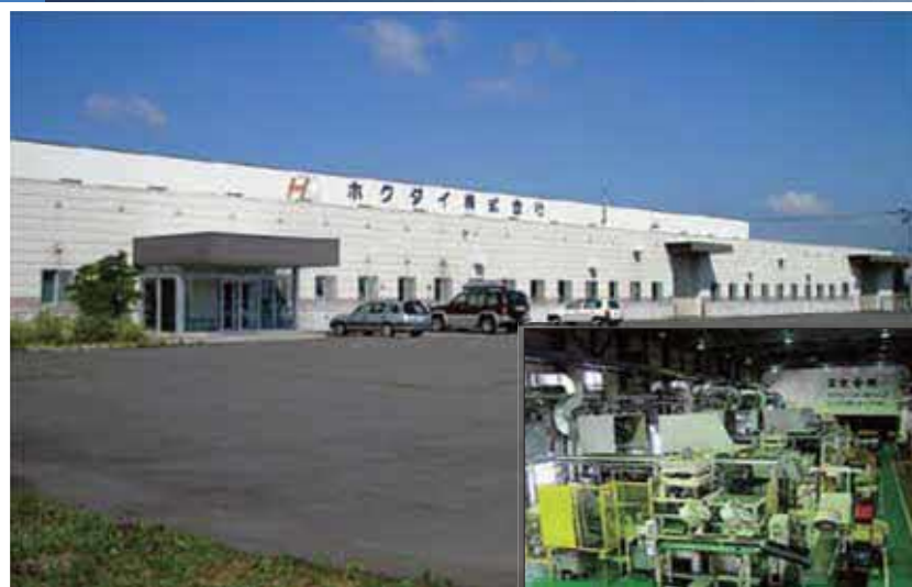
【ホクダイ外観写真】