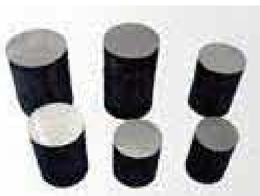
【鋼材の精密切断が可能です】

当社の主要製品は「鍛造用粗材材」と呼ばれる自動車のミッションに使用される部品です。お客様の要求に合わせ、高精度・高品質な材料切断、熱処理を行っています。