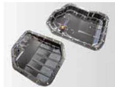
【カチオン塗装は高い防錆性能を発揮します】

自動車部品の生産で培った徹底した品質管理体制で、安定した品質で製品を供給することができます。