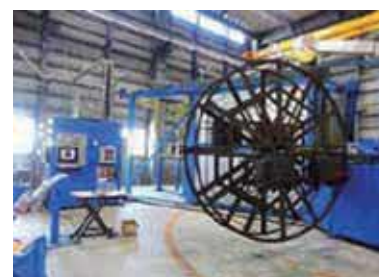
【炉成形フェリー機】

2019年に炉成形のフェリー機を導入により、ロックロール成形機では難しかった複雑形状の製品の開発が可能になりました。今後は蓄光、不燃、帯電防止樹脂を活用した商品開発に取り組んでまいります。