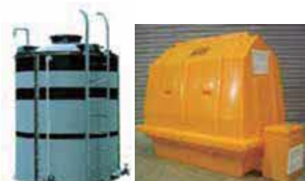
【大型円筒形タンク】【温風式子午乾燥保育機】

ポリエチレンを使用して回転成形という成形方法で製品・金型設計から製造までを一貫して行っており、最大20,000リットルタンクから10リットル相当の製品までを製造する成形機を保有しています。