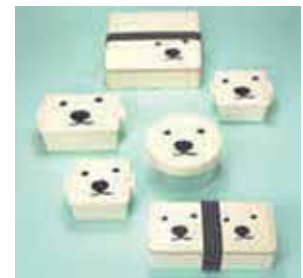
【保冷剤一体弁当箱】

プラスチック関連商品の製造メーカーとしてお客様のニーズにお答えする商品の開発に取り組んでいきたいと思っております。自社保冷弁当箱に関しては海外展開も含めて取り組んでいきます。