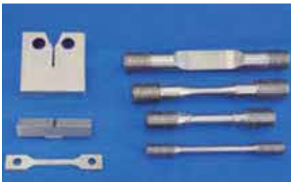
【材料試験用試験片製作】