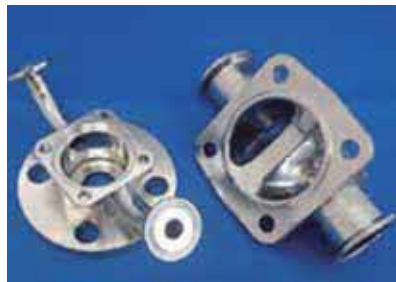
【エアー駆動ダイヤフラムバルブ】

最新の設備を導入する事で、高速・高精度加工を可能にし、複雑な形状を放電加工等に対応可能