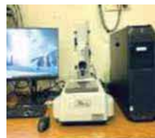
【非接触表面性状測定装置】

ボックスタイプでメーカー最上級機種ワイヤー線径0.05ミリ、加工精度±0.001保証。