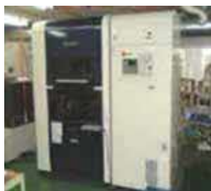
【超高濃度ワイヤー放電】

最新機種のリニアモーター駆動により、より微細な加工精度が可能になっている。面粗度も従来機より向上しているため0.002以下の加工精度仕上が可能。