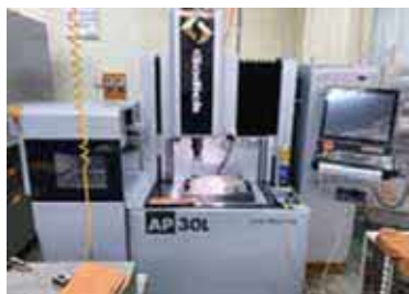
【型彫り放電加工機 AP30L】

最新機種のリニアモーター駆動により、より微細な加工精度が可能になっている。面粗度も従来機より向上しているため0.002以下の加工精度仕上が可能。