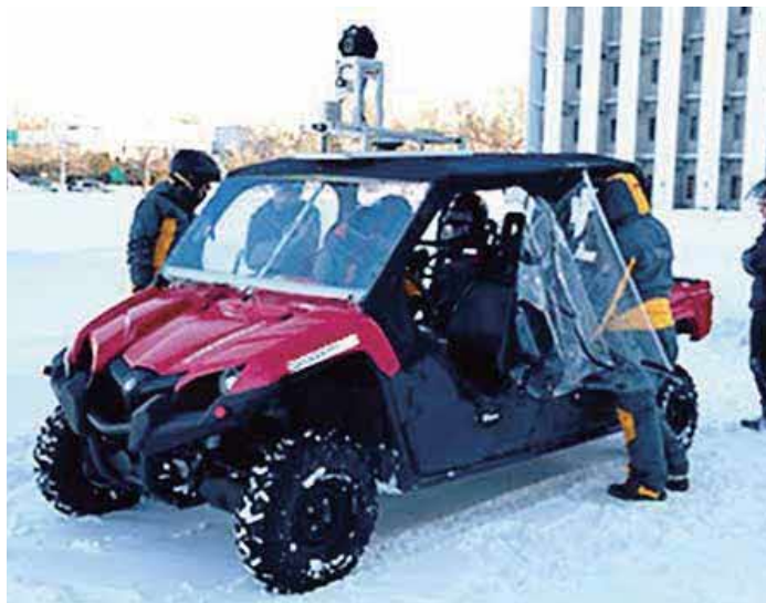
【冬季自動運転実証試験】

ちいさな会社、大きな仕事。“もっと、お客様のために”を合言葉にソフトウェアで輝く未来づくりを目指します