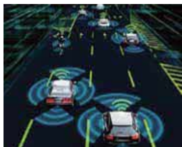
【つながるくるまのサイバーセキュリティ】

自動運転の実用化や、自動車のI o T化に必要な、高度な情報セキュリティ対策ならびに高信頼性対策を講じた車載システムの開発を得意としています。