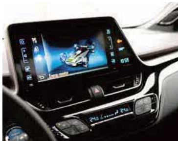
【車載H M Iソフトウェア開発】

車載H M Iソフトウェア開発支援ではI M F Lを基礎としたモデルベース型H M Iフレームワークで、車載ソフトウェアに求められる高信頼なソフトウェア開発をご支援します。