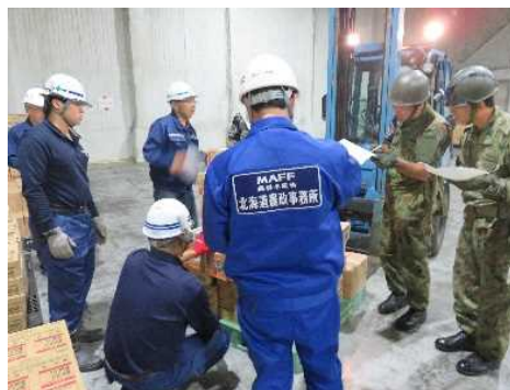
仕分け作業打合せ