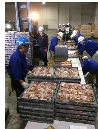
支援物資確認・詰替え作業