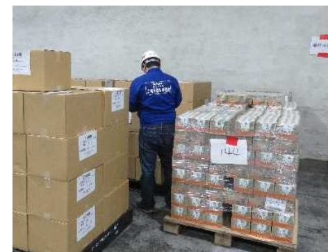
到着支援物資の確認