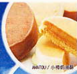
AMATOU / 小樽奶油酥