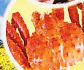
北海道特产“帝王蟹” 由北海道料理有股份