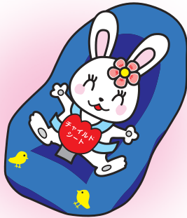
チャイルドシート着用 推進シンボルマーク 「カチャピョン」