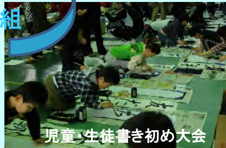
児童・生徒書き初め大会