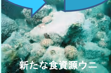
新たな食資源ウニ