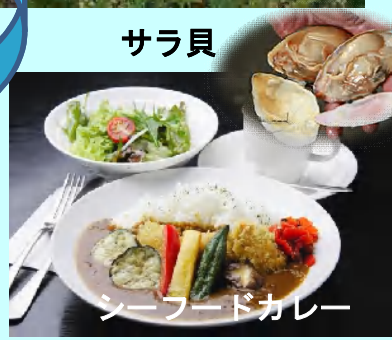
シーフードカレー