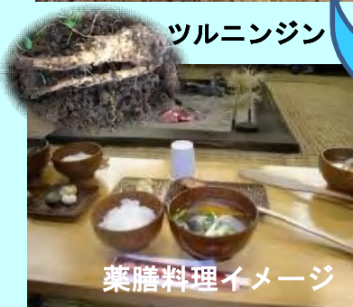
薬膳料理イメージ