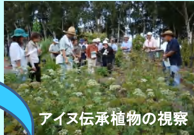
アイヌ伝承植物の視察