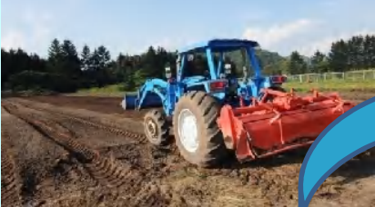
伝承有用植物の農園づくり