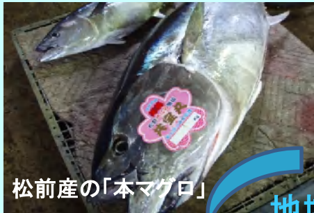
松前産の「本マグロ」

水産や観光などの地域資源を活かした経済の活性化と、地域の支え合いの仕組みづくりを推進し、古くから受け継がれてきた郷土愛や連帯意識に裏打ちされた田舎町ならではの、ぬくもりや優しさのある地域をめざす。