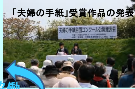
「夫婦の手紙」受賞作品の発表