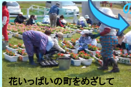
花いっぱい町をめざして