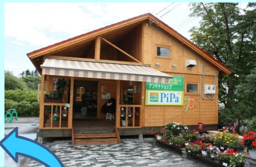
アンテナショップ「PiPa」