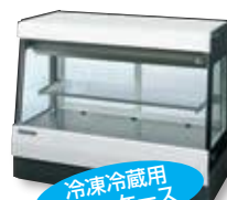
冷凍冷蔵用 ショーケース