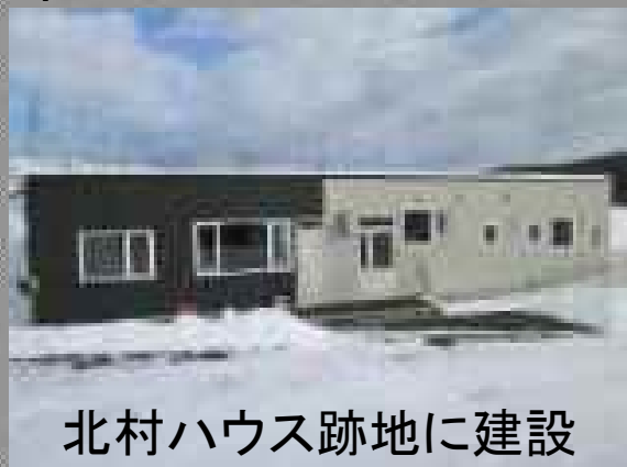
北村ハウス跡地に建設