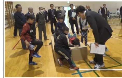
（避難所における就寝方法）