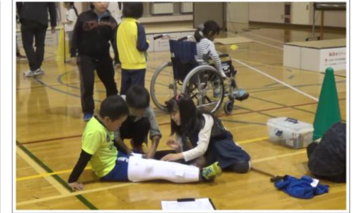
（避難所における要配慮への対応）