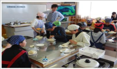
家庭科：災害食づくり