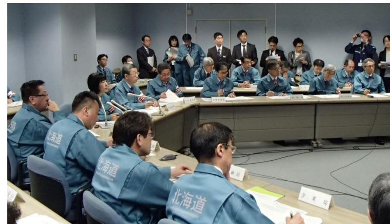
(連絡本部員会議) 知事を本部長とし、副知事・部長級、振興局長が出席