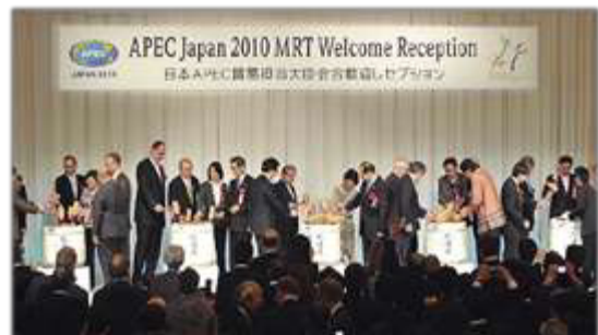
〈イメージ〉 歓迎レセプション( 左 太平洋島サミット 右 APEC 貿易担当大臣会合 )