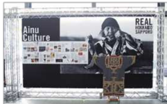
〈イメージ〉 情報発信ブースの設置 (APEC 貿易担当大臣会合)