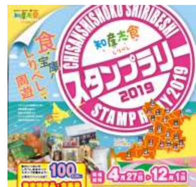
スタンプラリーちらし