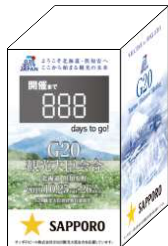
〈イメージ〉 カウントダウンモニュメント