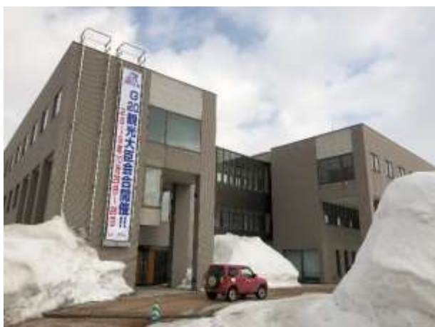
後志総合振興局（懸垂幕）