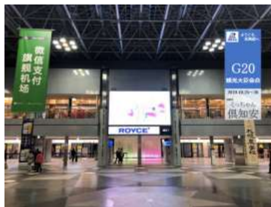
<イメージ> 新千歳空港ターミナルビル（パナー）