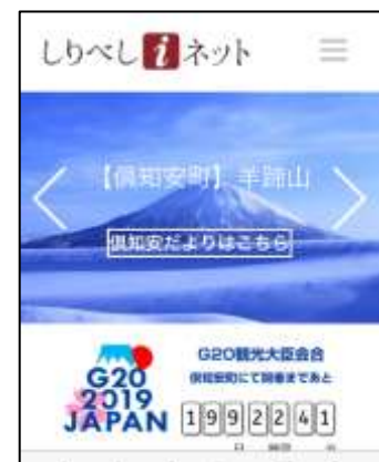
しりべしネットトップページ