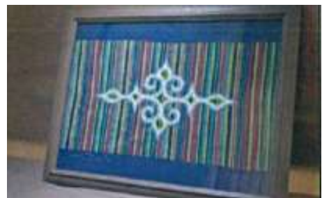
〈イメージ〉 二風谷刺繍タペストリー(額入り)