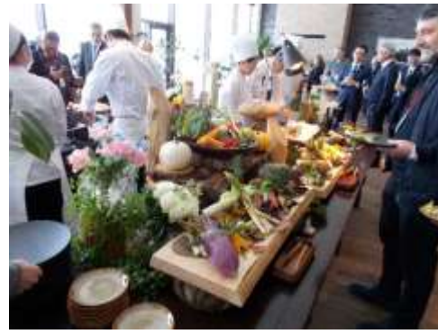
NIKI Hills(仁木町)での昼食会