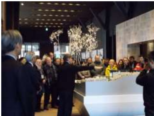
ニセコ HANAZONO リゾート