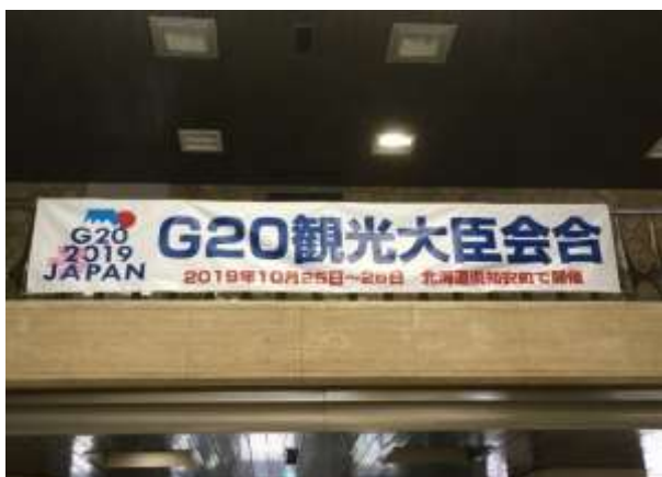
道庁本庁舎（横断幕）