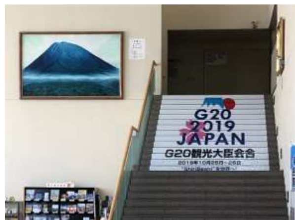
後志総合振興局（ステッカー）