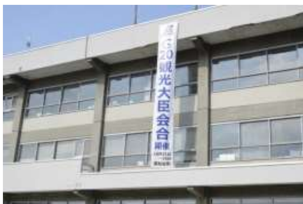
倶知安町役場（懸垂幕）