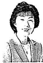
高橋はるみ 北海道知事