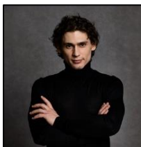
イワン・ワシリーエフ