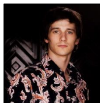
イワン・ザイツェフ