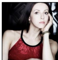
イリーナ・ペレン