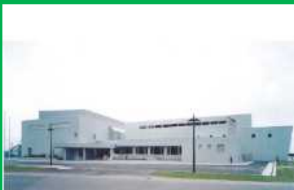
奥尻町～海洋研修センター