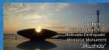
Kitahiro – Sculpture of the 2011 Great East Japan Earthquake Memorial Museum “Ikushoh”