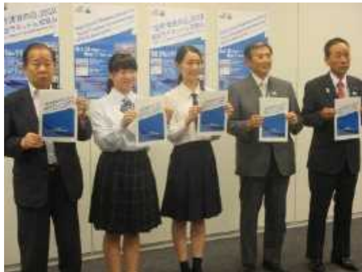
昨年和歌山県開催時の記者会見の様子