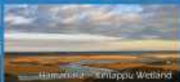
Hammerhead – Kitlappu Wetland

Organizers: Hokkaido Government / Hokkaido Board of Education