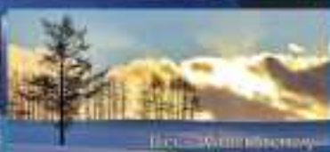
Kitahiro – White Horseway