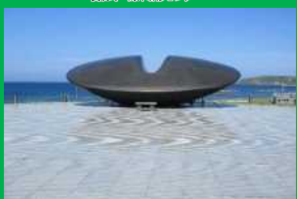
奥尻町～北海道南西沖地震の慰霊碑「時空翔」