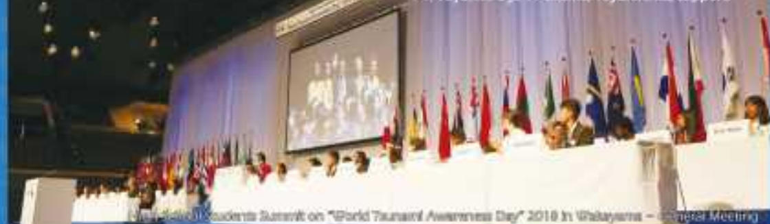
High School Students Summit on “World Tsunami Awareness Day” 2019 in Hokkaido – General Meeting

1-1, Toyohira 5-ji 11-chome, Toyohirakita, Sapporo