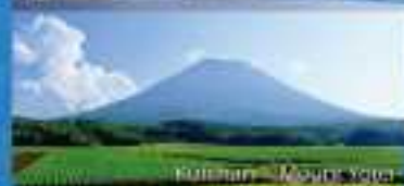
Kitahiro – Mount Yotei