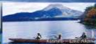
Kitahiro – Lake Akom