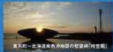
美瑛町—北海道各地の慰霊碑「時空館」