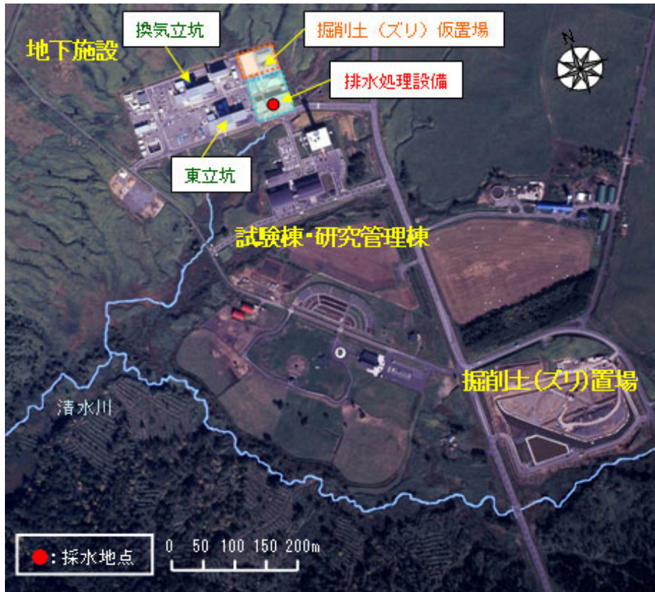
試料採取ポイント図 (1) (坑道からの排水、排水処理後の水)