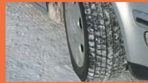
冬天雪道专用轮胎是租车公司车子的标准配备。

在北海道有很多只有冬天才能享受到的乐趣，如滑雪、滑雪板和露天温泉等等。因此所携带的防寒衣物或道具等等也相当多。所以利用租车来移动是非常有用的。虽然这么说，但是冬天道路的驾驶难度相当高。为避免引起不必要的纠纷，事前先做好基本知识的准备功课吧。