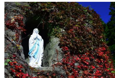
「ルルドの洞窟」 ・初代院長、思い入れのマリア像