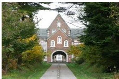
「トランプスト修道院」 ・日本初の男子修道院