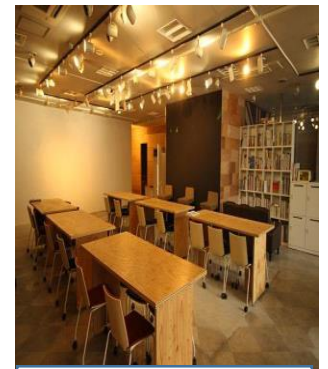
サテライトオフィス