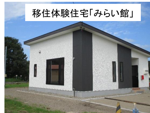
移住体験住宅「みらい館」