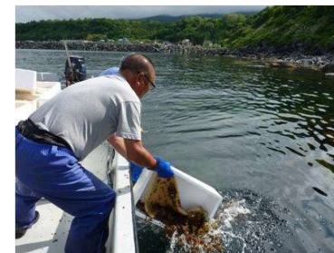
ウニ種苗の放流状況