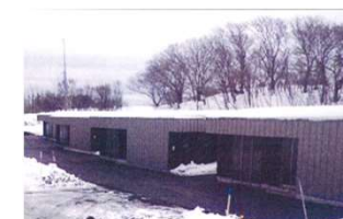
漁業担い手支援住宅