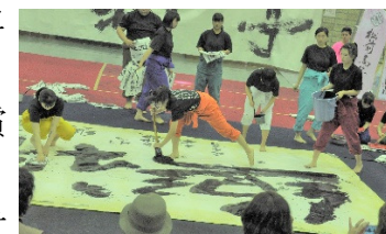
(松前高校書道部による書道パフォーマンス)