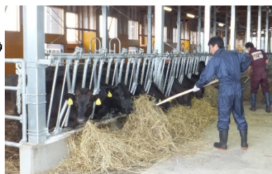
(肉牛改良センターでの研修)