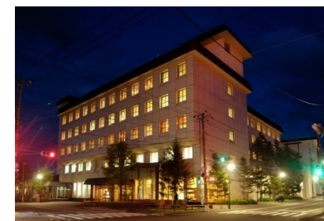
(返礼品「温泉宿泊券」)