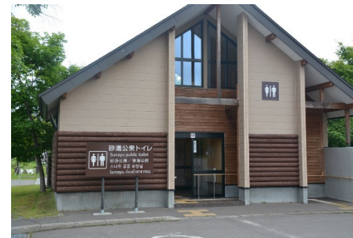
(国立公園内公衆トイレの多言語看板)