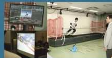
▲ 室内唯一の Sky Tech Sport Ski & Snowboard Simulator