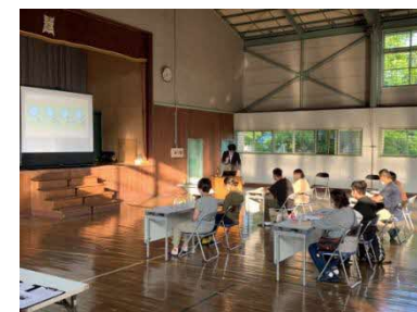
オープンスクールの様子