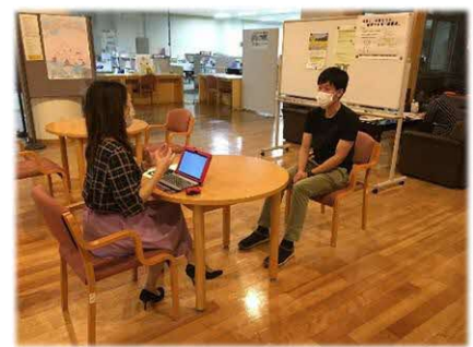
イベントに向けた男性研修会