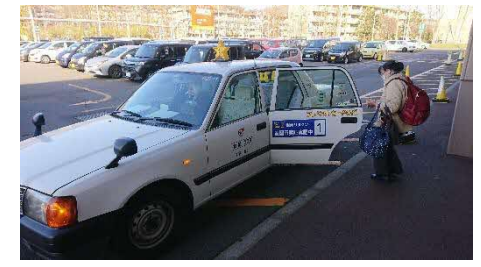
ICT技術を活用した室蘭MaaSプロジェクトの実施