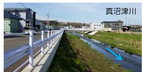
河道掘削等（胆振総合振興局）