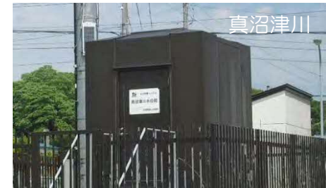
水位観測データの提供（胆振総合振興局）