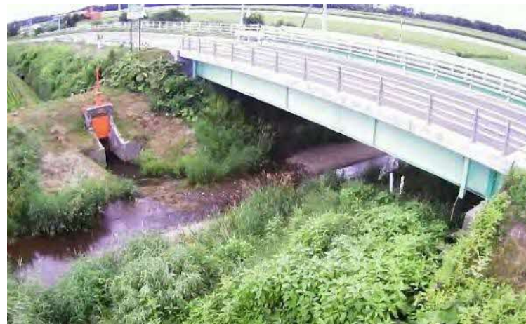
（入鹿別川）簡易型河川監視カメラによる映像提供