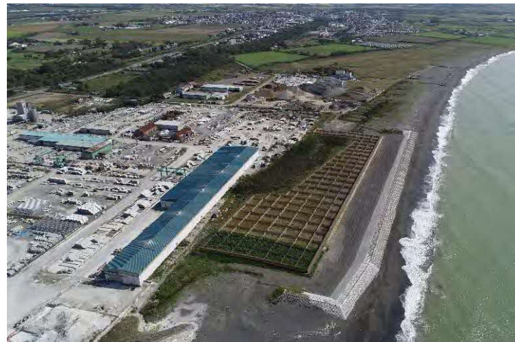
民有林内における防災林の整備