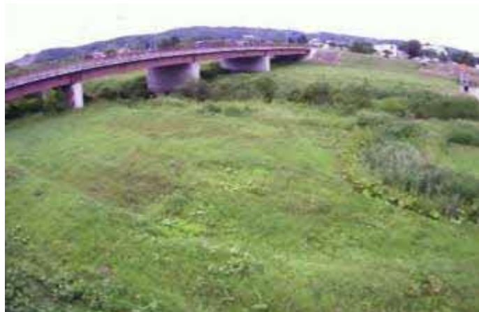
（厚真川）簡易型河川監視カメラによる映像提供