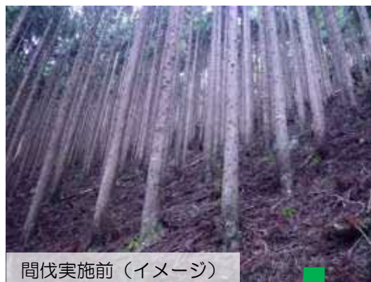
間伐実施前（イメージ）