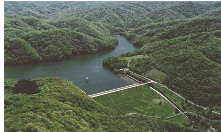
厚真ダム (室蘭開発建設部、厚真町土地改良区)