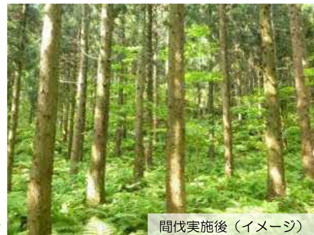
間伐実施後（イメージ）