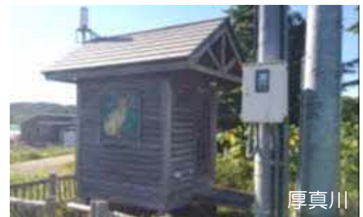
水位・雨量観測データの提供（胆振総合振興局）