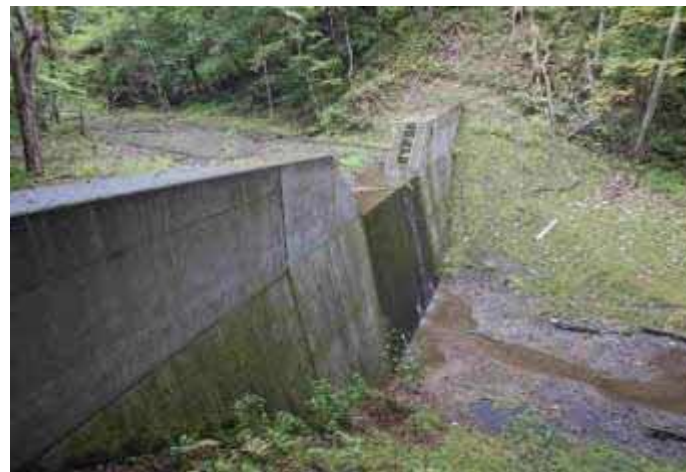
道有林内における治山ダムの整備