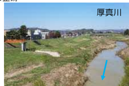
河道掘削等（胆振総合振興局）