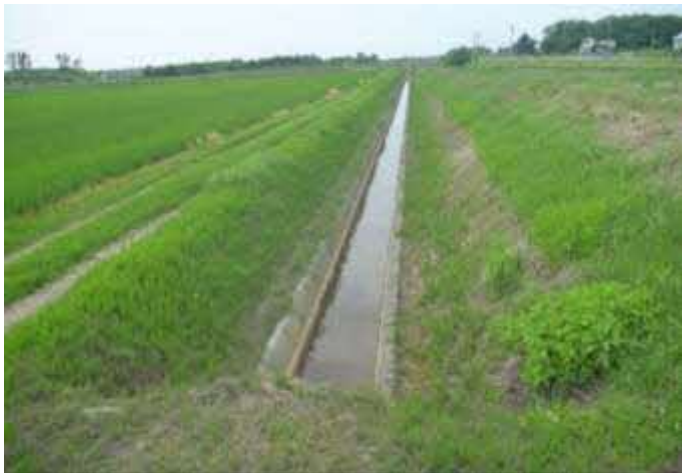
農業排水路の整備