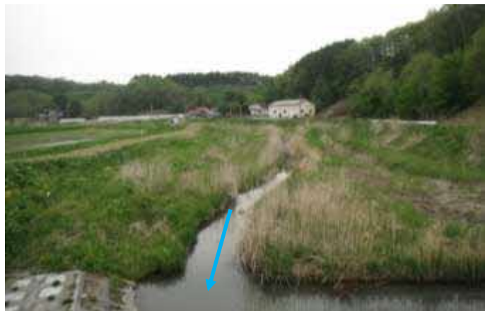
（ウクル川）河道掘削等の実施

まちづくり等での活用を視野にした多段的な浸水リスク情報の検討 （胆振総合振興局）