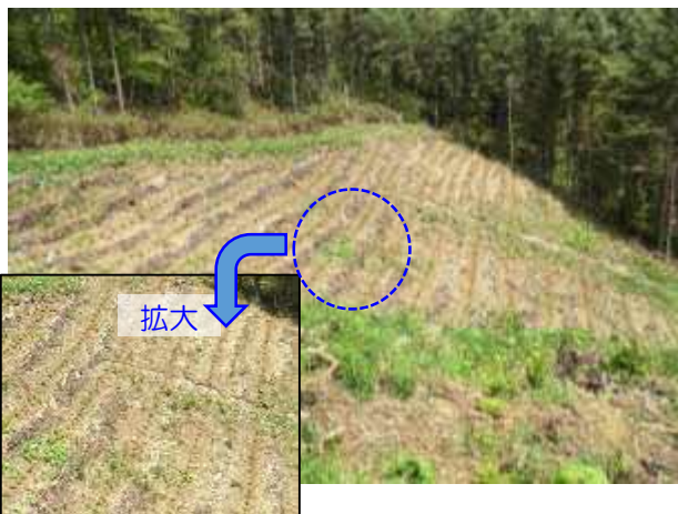
道有林内における植栽の実施（胆振総合振興局）